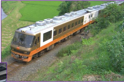
一ノ関駅方面へ真滝駅を出て直ぐの地点

1989 年に登場、東北本線や大船渡線で活躍した 3 両編成の観光列車で土日を中心に運行。