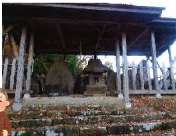
下街道「才の神石碑群」