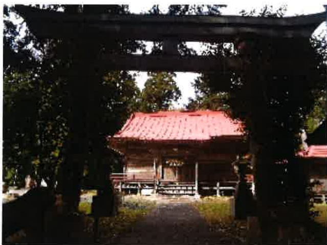
神秘の「熊野白山瀧神社」