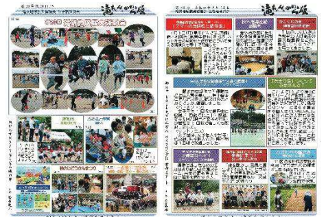
(裏)H. 29. 11. 20号 5号からカラー化し、各戸配布にしました。