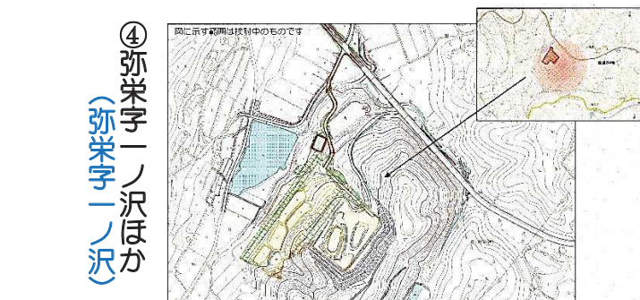
④ 弥栄字一ノ沢ほか (弥栄字一ノ沢)