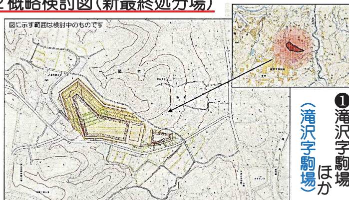
① 滝沢字駒場ほか (滝沢字駒場)