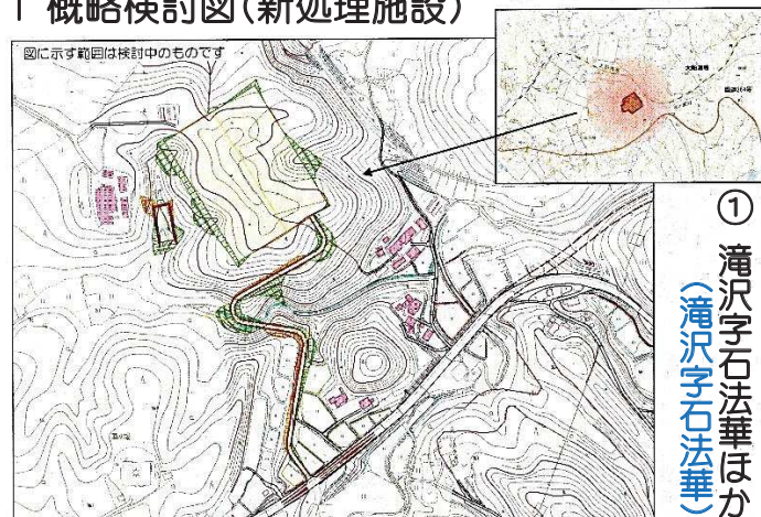
① 滝沢字石法華ほか (滝沢字石法華)