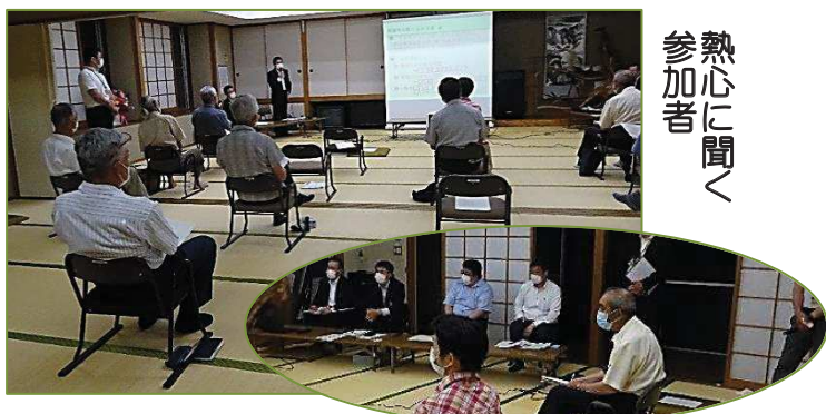
熱心に聞く参加者

7月4日と7日の両日、午後6時30分から、エネルギー回収型一般廃棄物処理施設・新最終処分場住民説明会が滝沢市民センターで地域住民約50人を集めて開かれた。一関地区広域行政組合（一関市・平泉町）関係者から各候補地の絞り込み方法や7月時点での各候補地8か所の建設場所の検討状況など説明が行われ、滝沢候補地の3か所と近隣2か所の検討図を当日資料から掲載した。次回の説明会は9月に予定、決定は今年度中としている。