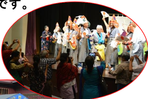
公演終了後ブータンの人々と交わる

牧沢・鶏舞はかつては真滝中で、今は一関東中で舞われているこの地域の伝統芸能です。