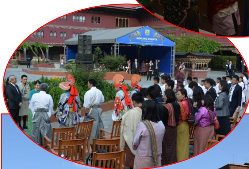
牧沢神楽一行にお言葉をおかけになる眞子様