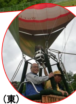
5. 28 滝沢市民センター 開所記念事業