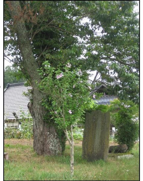
和算家潤泉翁寿碑

※インターネットでもご覧になれます。そのまま「滝沢お宝マップ」と入力して検索してみてください。