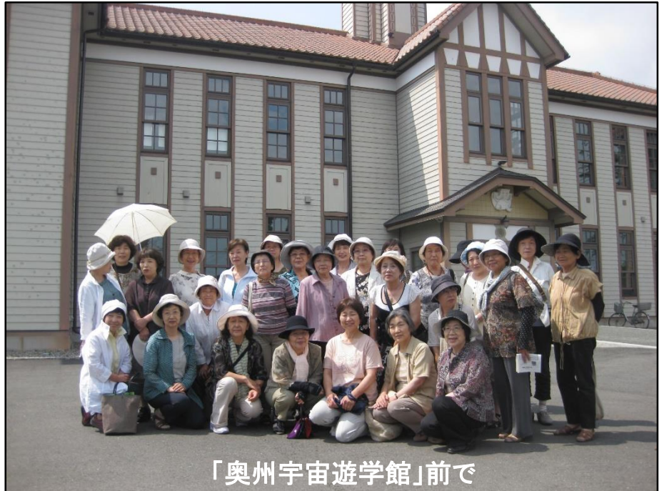
「奥州宇宙遊学館」前で

7月15日(水)、毎年好評の移動研修が開催され31名の参加がありました。今回は教室(滝沢分館)を飛び出し、奥州市内6箇所を巡り研修してきました。普段は足を運ばない奥州市の各施設や場所でしたが、改めて奥州市を勉強することができました。研修は①奥州宇宙遊学館 ②及川漆工房 ③武家住宅資料館 ④岩谷堂筆筒製作所ショールーム ⑤館山公園と回り、最後は⑥江差ふるさと市場で締めくくりました。